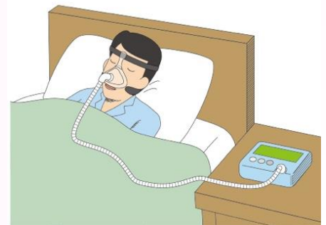
CPAP(シーパップ)装着中

○予後:成人SASでは高血圧、脳卒中、心筋梗塞などを引き起こす危険性が約3～4倍高くなり、特に、AHI30以上の重症例では心血管系疾患発症の危険性が約5倍にもなります。しかし、CPAP治療にて、健常人と同等まで死亡率を低下させることが明らかになっています。