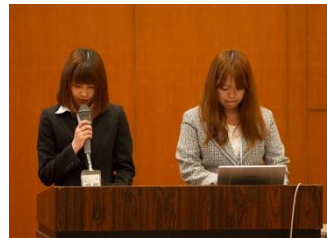
東濃デイサービスセンター東館

今回は3事業所が優秀賞に輝きました。優秀賞に選ばれた事業所のみなさんおめでとうございます。