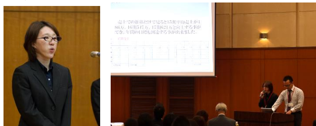
東濃デイサービスセンター滝呂