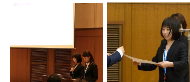
土岐内科クリニック