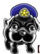
【ソレちゃん】 (岐阜県警察広報犬)